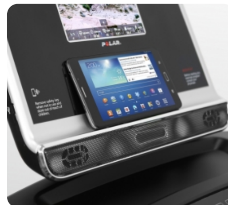
Подставка для гаджетов