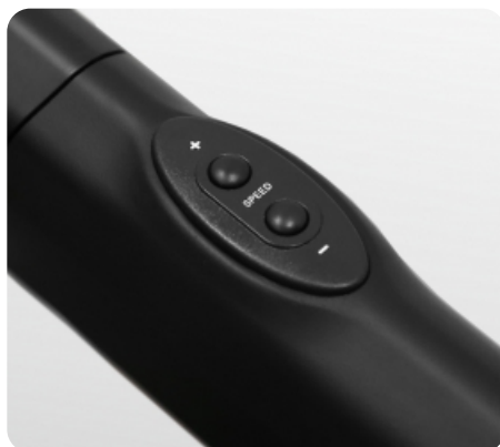
Дополнительные кнопки переключения наклона и скорости