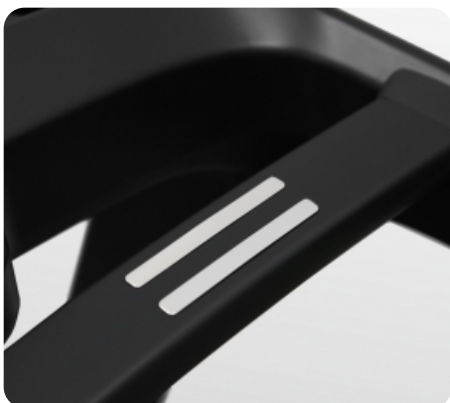
Сенсорные датчики пульса